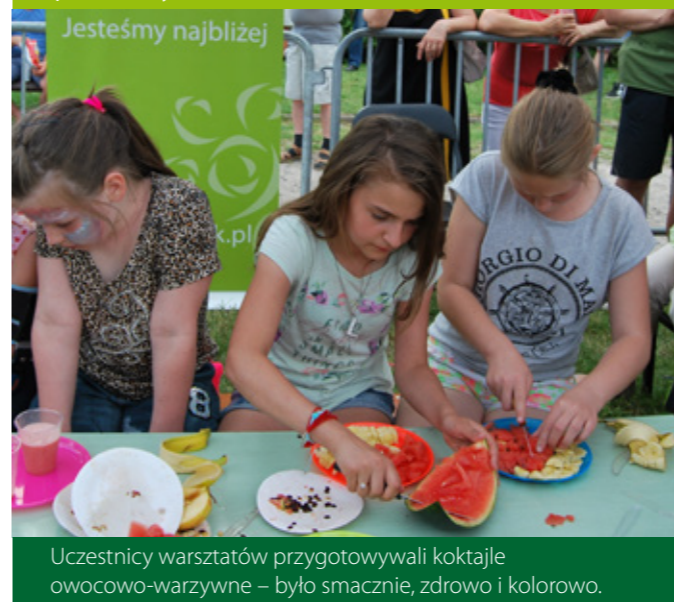
Uczestnicy warsztatów przygotowywali koktajle owocowo-warzywne – było smacznie, zdrowo i kolorowo.

Dni Radomska to dla radomszczan jedyna w swoim rodzaju okazja do integracji i wspólnej zabawy. Tegoroczna impreza, poza jubileuszowymi odniesieniami, jak zawsze pełna była atrakcji dla starszych i młodszych. W ofercie znalazły się m.in. warsztaty kulinarne dla dzieci, które, łącząc teorię z praktyką, pomogły poszerzyć wiedzę na temat zdrowego odżywiania. Sponsorem wydarzenia został ESBANK Bank Spółdzielczy.