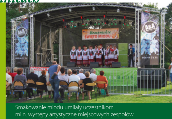
Smakowanie miodu umilały uczestnikom m.in. występy artystyczne miejscowych zespołów.

Chłopcy do lat 13, chłopcy do lat 16, kategoria dla dziewcząt bez podziału ze względu na wiek i otwarta dla wszystkich miłośników koszykówki ulicznej kategoria OPEN. Do tego pasja, sportowy duch, dobry humor i zasady fair play. To niezmiennie elementy wrześniejszej ESBANK Streetballmanii. W tym roku organizację turnieju wsparła firma BW Logistyka, dzięki której turniej można było zaplanować w prawdziwie ulicznej scenarii – na parkingu Era Parku Handlowego.