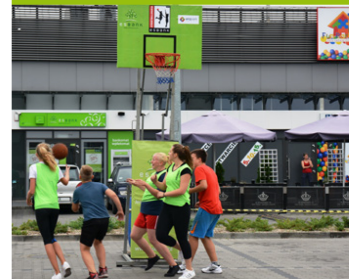
Era Park Handlowy w Radomsku gospodarzem ESBANK Streetballmanii został po raz drugi.

W centrum handlowym można robić nie tylko zakupy. Po raz kolejny udowodnił to ESBANK Bank Spółdzielczy, zapraszając radomszczan na Turniej Koszykówki Trzyosobowej na terenie ERA Parku Handlowego.